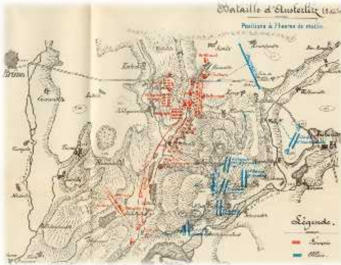
Mapa mostrando a manobra durante a Batalha de Austerlitz

Napoleão enviou emissários aos imperadores russo e austríaco, a fim de sondá-los acerca de uma possível paz. Em resposta, o imperador russo Alexandre enviou um plenipotenciário com as condições para a paz. Napoleão fingiu estudar a proposta, hesitou, suspirou, e terminou por repudiá-la, fingindo-se desesperado, mas disposto a vender caro sua derrota. O emissário russo, enganado, tranquilizou o estado-maior austro-russo, que adotou o Plano Weyrother: um ataque principal contra o “fragilizado” flanco direito