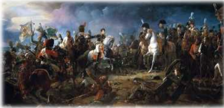
Napoleão com seus oficiais durante a Campanha da Áustria

do Arquiduque Carlos, o mais capaz general austríaco naquela altura, composto por 90 mil homens, estava retido no norte de Itália, fixado