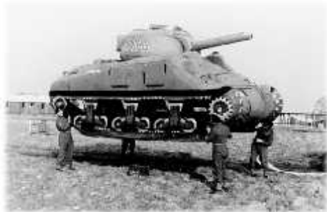
Simulacro de um blindado M-4 Sherman utilizado para iludir a espionagem alemã às vésperas da invasão da Normandia

“cometeram enganos”, surrupiando projetos, correndo risco de vida; que erraram propositalmente na construção das fundações, enfraquecendo a