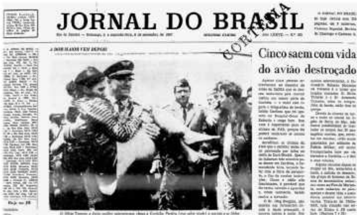
O Jornal do Brasil noticia o resgate dos sobreviventes.

Por volta das 1140 h foi feita uma primeira tentativa de descida no local do acidente, mas as condições meteorológicas desfavoráveis não permitiram. Por meio de gestos e acenos foi possível uma primeira comunicação com os sobreviventes.