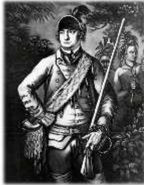
Robert Roger, criador dos Rangers

Essas táticas surgiram na América do Norte por causa da situação específica de lá, onde já havia unidades mistas, de nativos e colonos, desde o século XVII, estas operando como infantaria ligeira – certamente não tinham condições de fazê-lo em linha.