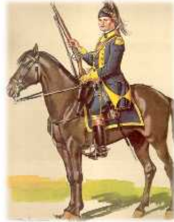
Soldado do Regimento de Dragões do Rio Grande

As descrições acima, no tocante aos uniformes – ou a falta deles – podem dar a ideia de uma tropa desleixada, que não passaria confiança na sua habilidade para enfrentar soldados regulares, em campo aberto. Na verdade, isso era uma visão comum em todo mundo na época, onde os oficiais das tropas regulares viam com certo desprezo os irregulares, o serviço neles não sendo considerados como uma opção de carreira. 25 No entanto, como vimos para o Rio Grande do Sul, eram tropas que, operando nas condições apropriadas, podiam ser