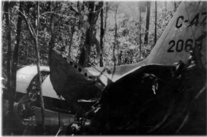
Os destroços do C-47 FAB 2068 no interior da Floresta Amazônica após o desastre

o transmissor, pois naquele momento fariam um pouso de emergência na selva. Em seguida o tétrico som ininterrupto do manipulador premido indicou que aquele voo terminara.