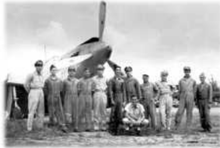
Os aviadores brasileiros na República Dominicana

desejado golpe, Trujillo planejou o início do movimento simulando uma rebelião de militares da Aeronáutica, fazendo um bombardeio sobre os quartéis e prédios governamentais por aviões dominicanos portando as cores das aeronaves da Fuerza Aerea Venezolana.