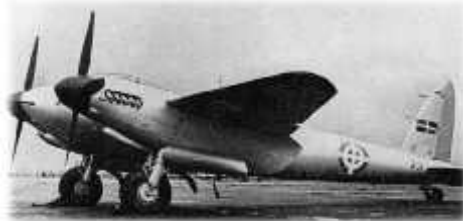
O De Havilland Mosquito, um dos ícones da 2ª Guerra Mundial, foi um dos aviões voados pelos brasileiros na República Dominicana.