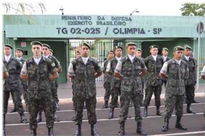
Atiradores do Tiro de Guerra 02-025, com sede em Olímpia-SP: defesa da Pátria e cidadania.

tradições do Exército Brasileiro a sucessivas gerações de jovens que passam por suas mãos. Os sargentos preparam verdadeiros multiplicado-