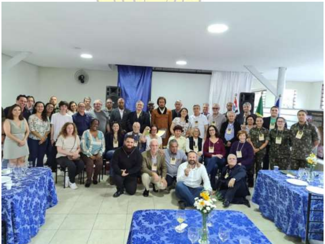
Comitiva em Aparecida, Secretaria de Turismo