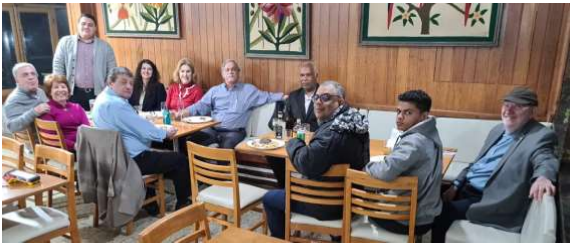
Jantar na Estalagem das Minas Gerais, SESC, Ouro Preto