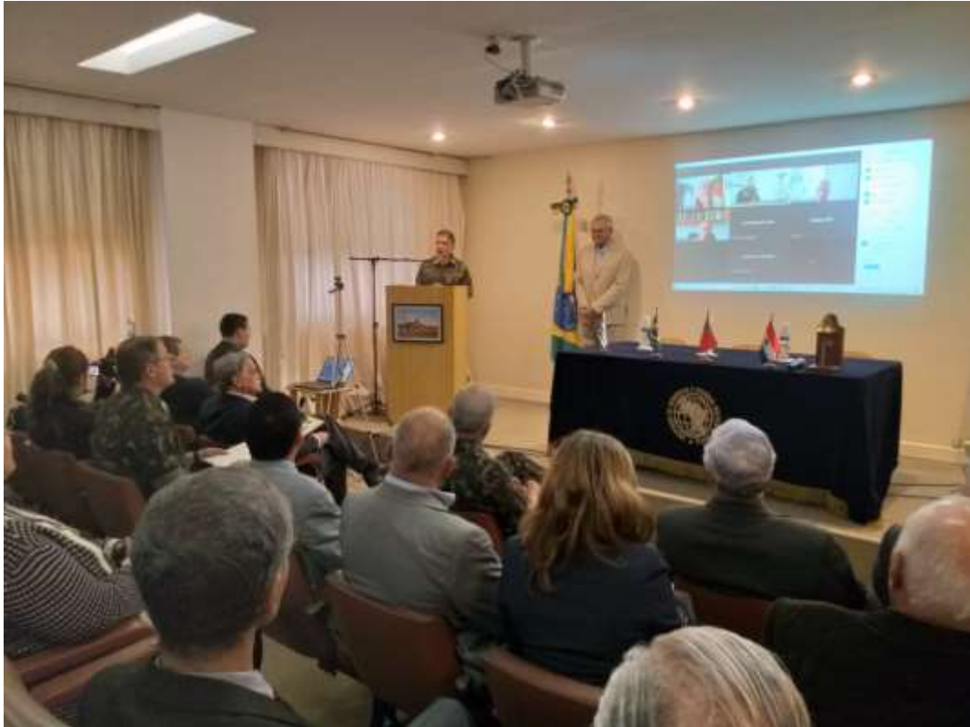
General Lancia usando da palavra