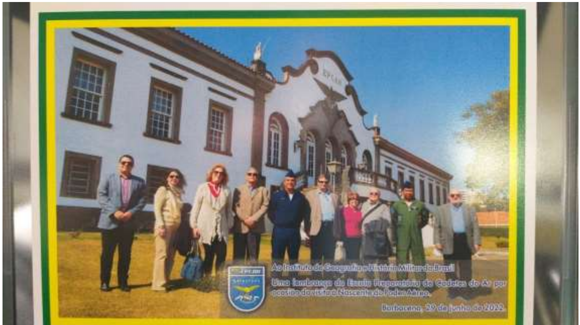
Quadro oferecido pelo Comandante da EPCAR - Barbacena