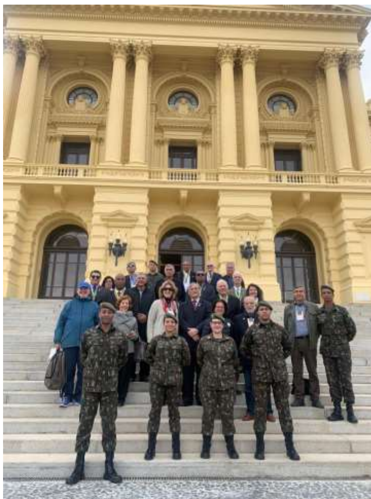
Comitiva na visita ao Museu do Ipiranga, São Paulo