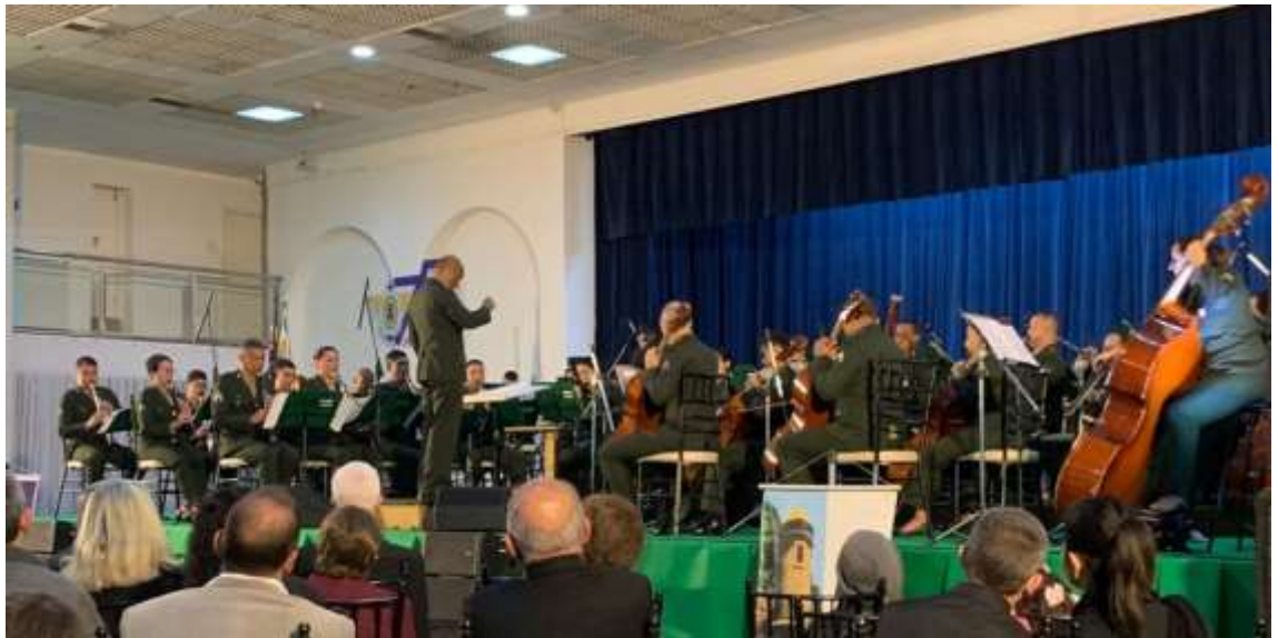
Orquestra Sinfônica do Exército, Círculo Militar de São Paulo