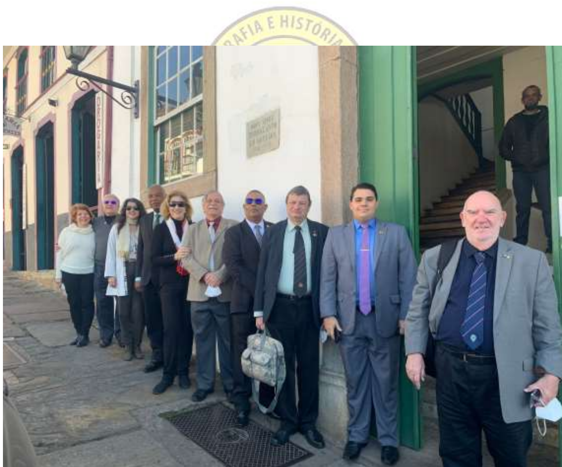
A Comitativa em Ouro Peto