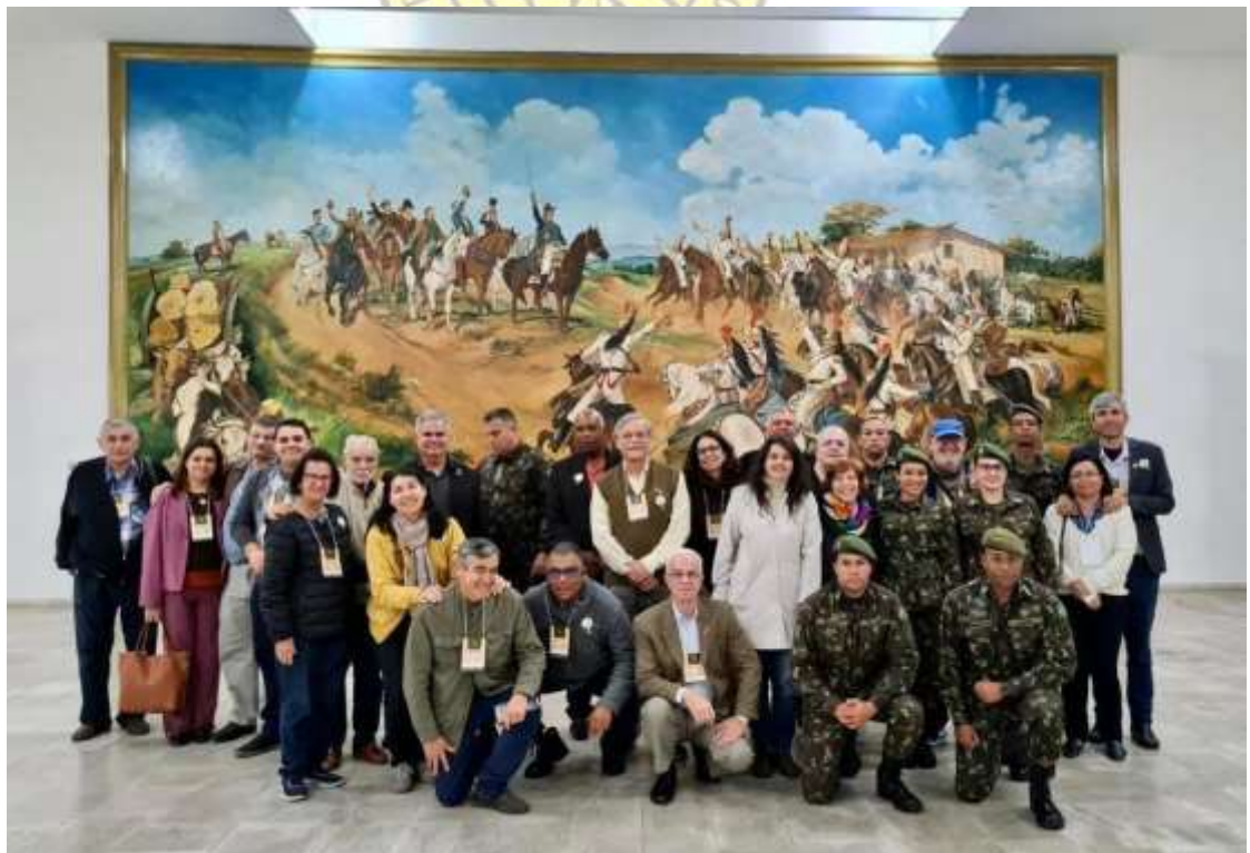
Comitiva no QG do CMSE