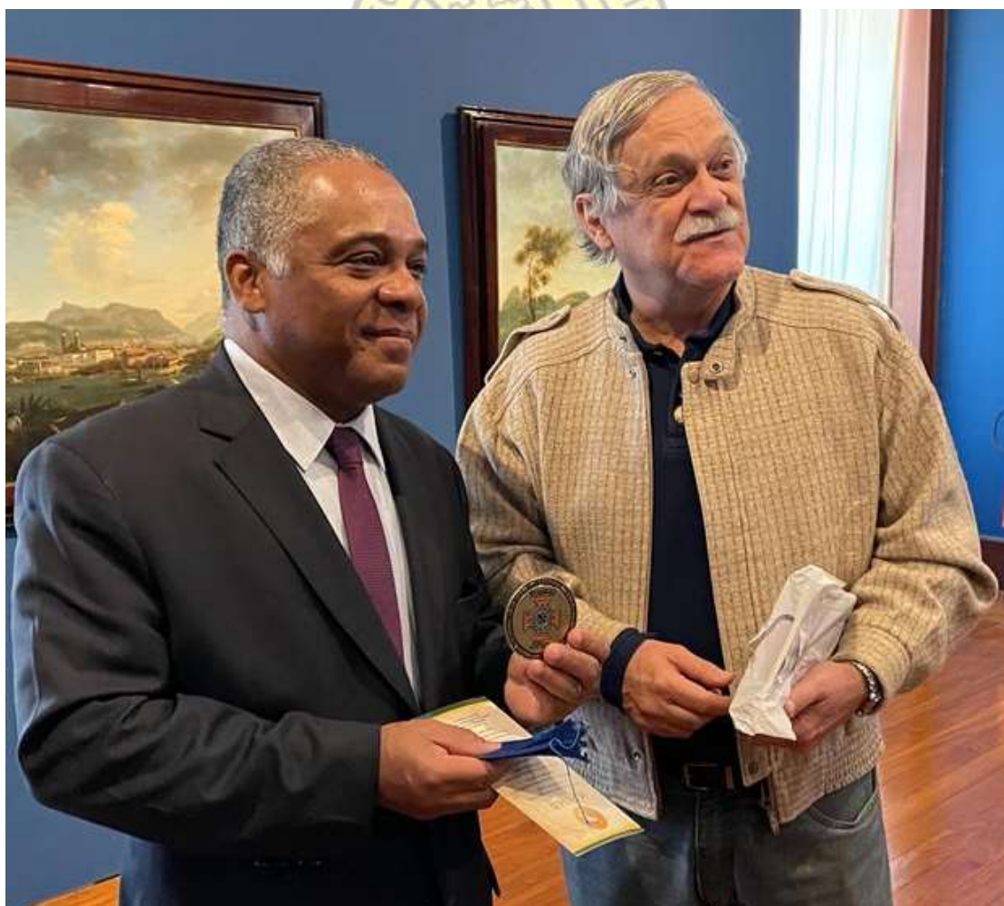
Diretor do Museu Imperial recebe Medalha do Instituto