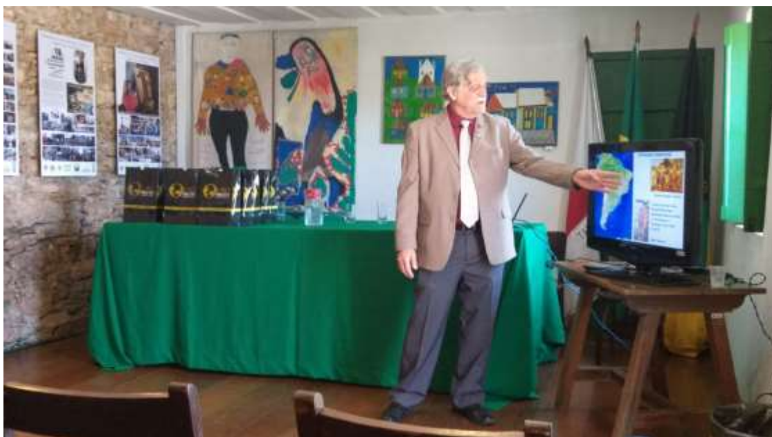
Palestra do Gen BERGO na Prefeitura de Ouro Peto