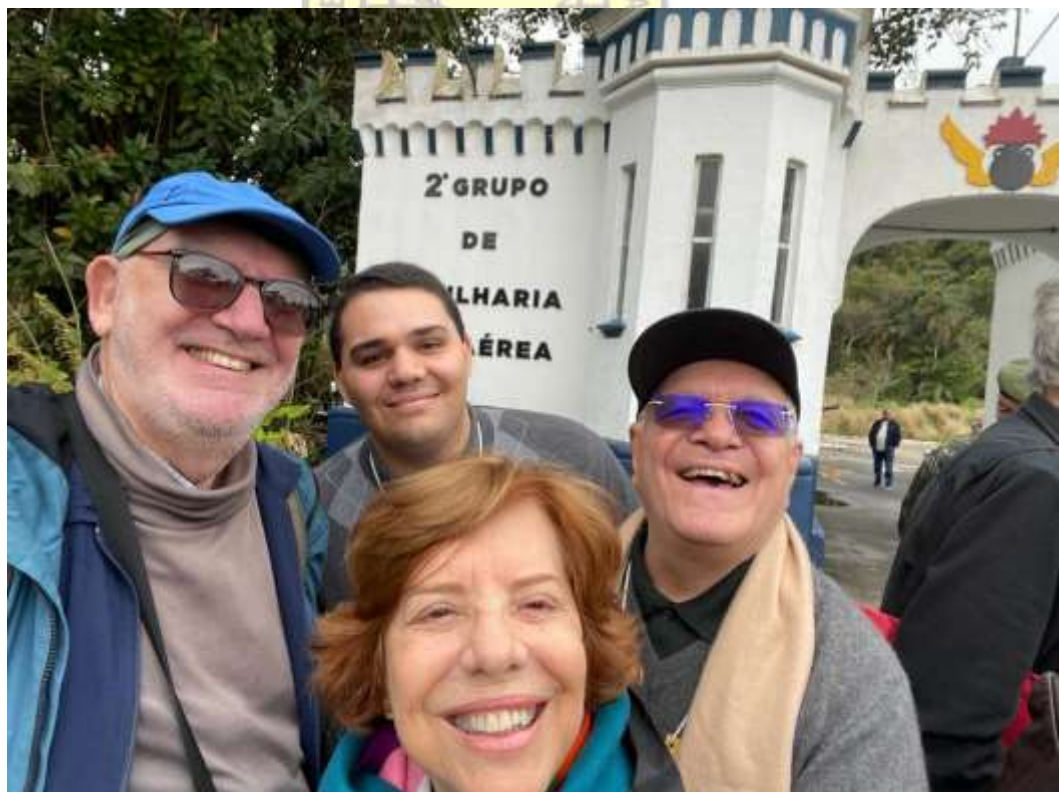
Participantes da comitiva na chegada à Fortaleza de Itaipú