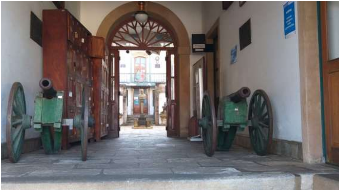
Escola de Minas – Ouro Preto