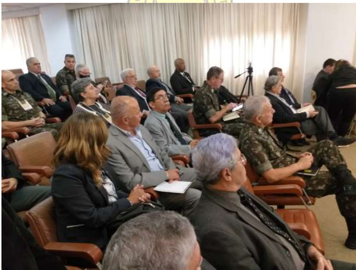
Vista do auditório do Clube Militar - Senna Madureira Av. Rio Branco