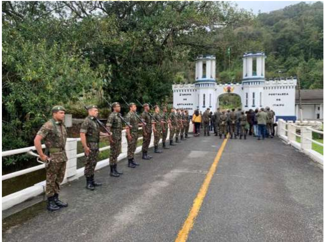
Chegada da comitiva à Fortaleza de Itaipú, Santos-SP