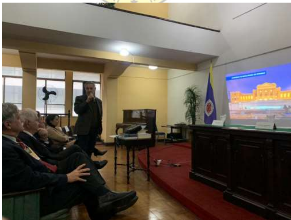
Palestra no Instituto Histórico de São Paulo