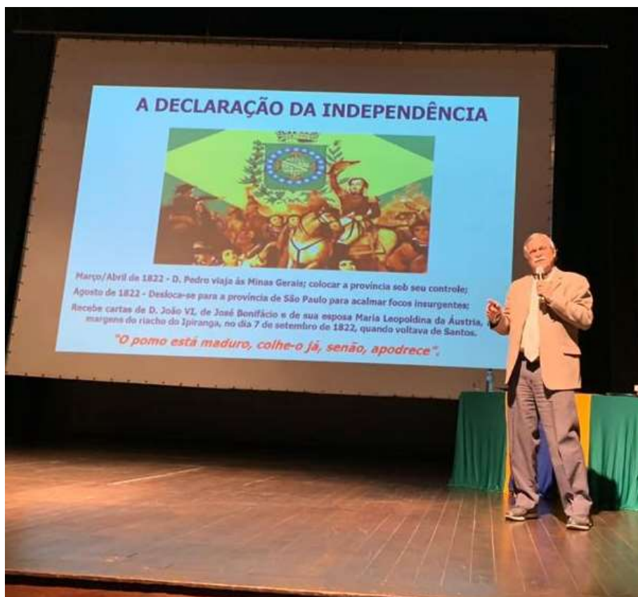
Palestra do Gen BERGO em Mariana