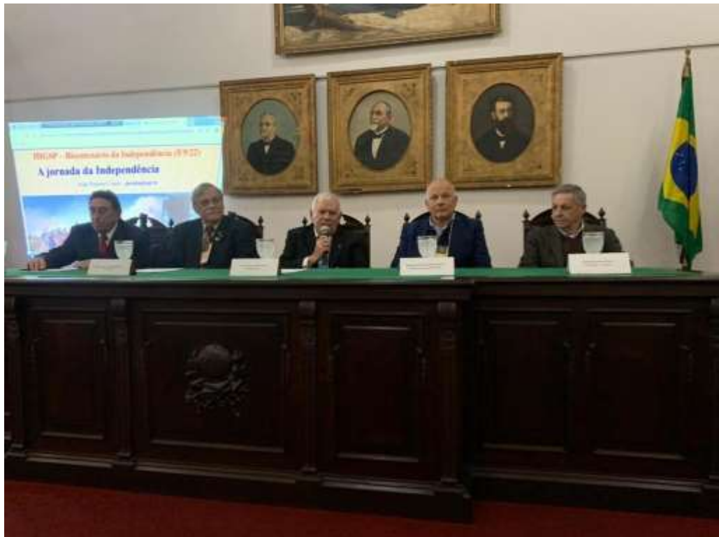
Mesa Diretora dos trabalhos no Instituto Histórico de São Paulo