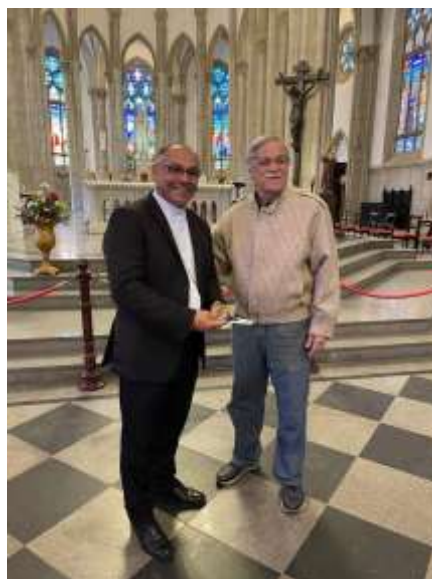
Bispo Diocesano de Petropolis, Dom Gregorio Recebe o Medalhao 200 Anos do Gen BERGO na Catedral