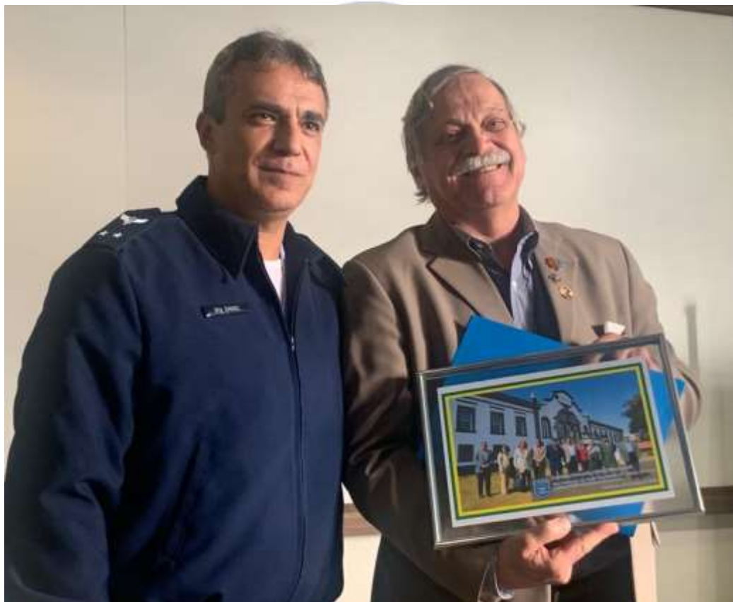
Comandante da EPCAR - Barbacena