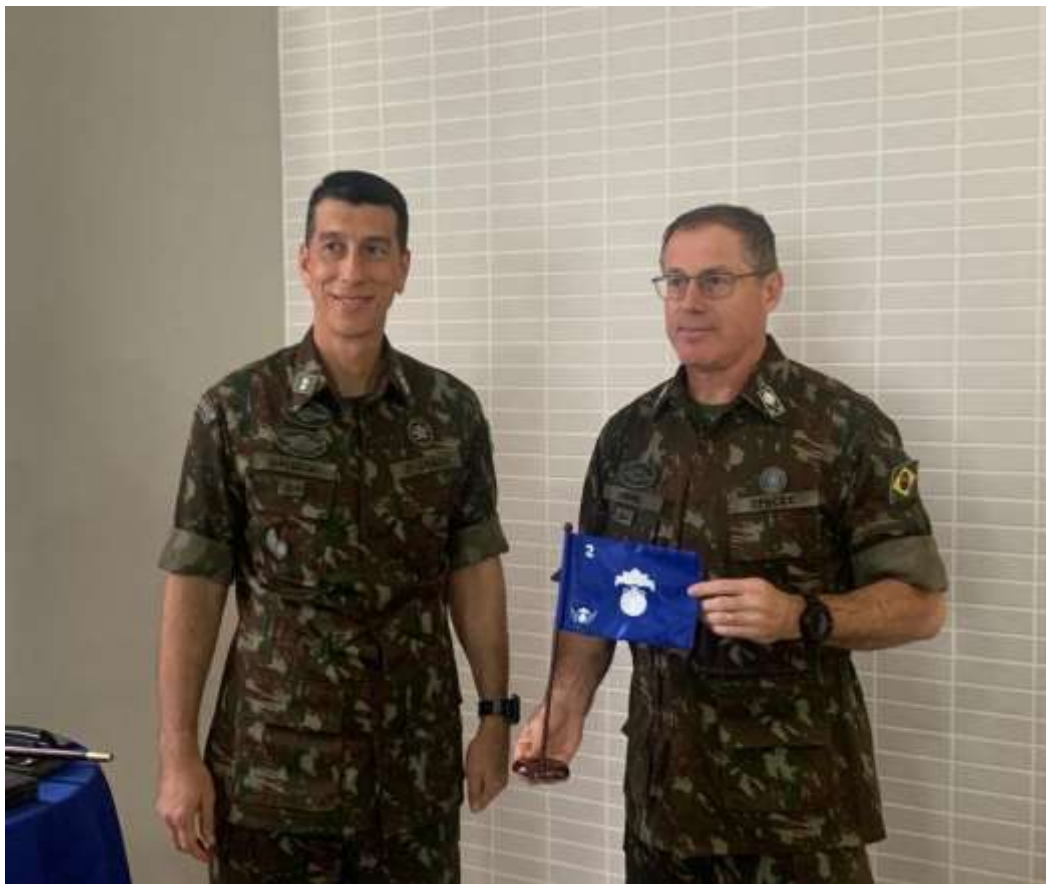
General Sibinel com o Comandante Ten. Cel. Gallego da Fortaleza de Itaipú