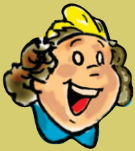
JOAQUIM JOSÉ DA SILVA XAVIER O TIRADENTES

- EU E O MINISTRO JOSÉ BONIFÁCIO, ASSIM COMO OUTRAS PESSOAS, QUERÍAMOS MUITO LIBERTAR O BRASIL DE PORTUGAL.