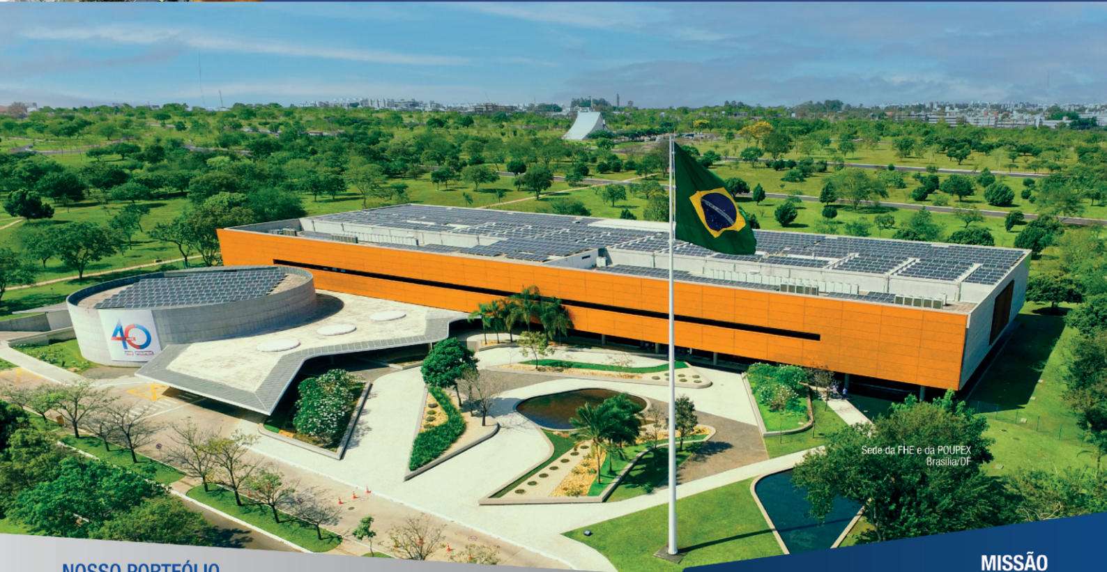
Sede da FHE e da POUPEX Brasília/DF