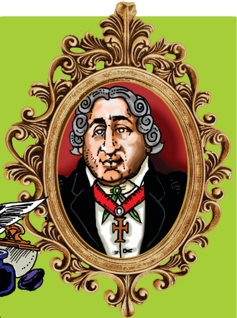
JOSÉ BONIFÁCIO DE ANDRADA E SILVA